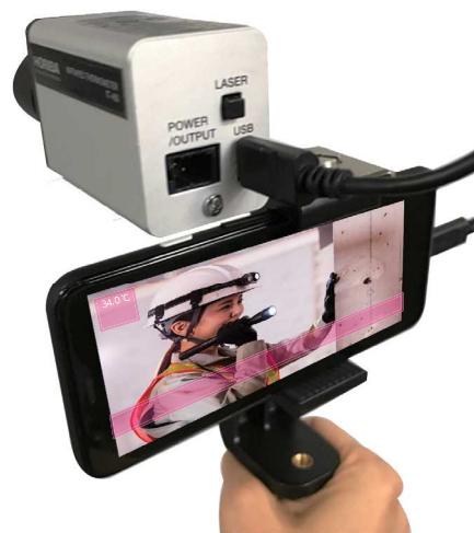
画像はハメコミです。