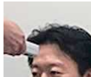
非接触式放射温度計

右表のような検証をされた後に、A社様のご判断で非接触式放射温度計の表示値に2°Cを加えて接触式温度計(わき用)の値として読み替えて運用されています。